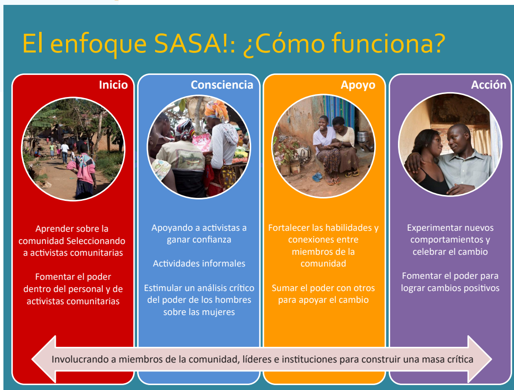
FIGURA 3: El enfoque de SASA!

SASA!, < http://raisingvoices.org/sasa >.