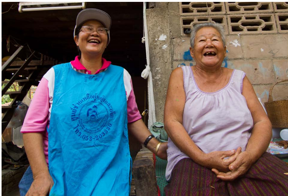
วิรัชการ จีเลิศศิลป์ได้ศึกษาและจัดทำรายงานกับผู้สูงอายุ