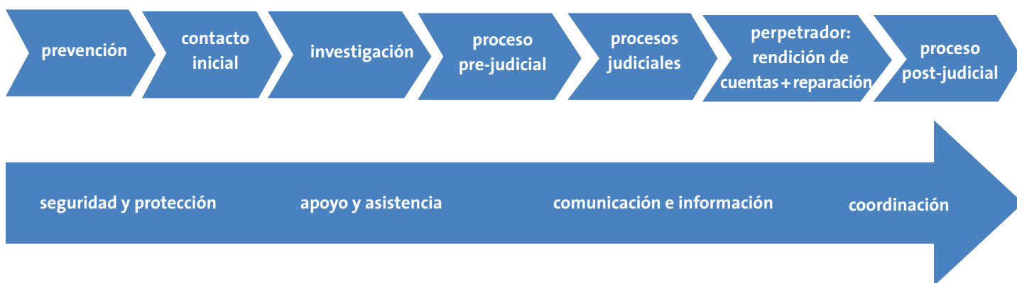
DIAGRAMA 1: El continuo de la justicia

Dada la diversidad de culturas, tradiciones y sistemas jurídicos, así como la variedad de mandatos y tareas de los organismos del sector policial y judicial en todo el mundo, en este módulo se utiliza el término genérico “proveedor de servicios de justicia”, que se centra en las