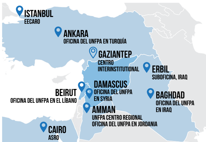
Respuesta del UNFPA a Siria: oficinas regionales, oficinas de país y centro, y centro interinstitucional de Turquía.

El conflicto en Siria, actualmente en su octavo año de duración, ha tenido un profundo efecto en toda la región. Para fines de 2017, 13.1 millones de niños, niñas, mujeres y hombres sirios precisaban de ayuda humanitaria; 6.1 millones dentro de Siria y 7 millones en los países circundantes. Alrededor de tres millones de personas en Siria se encuentran en áreas sitiadas y difíciles de alcanzar, expuestas a graves violaciones de protección.